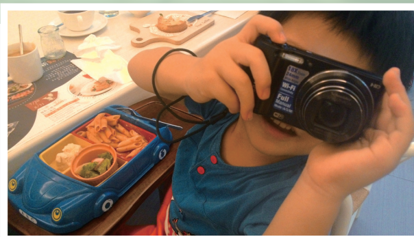
近年發生多起重大食安事件，公權力卻未能將黑心業者繩之以法，讓社會大眾食得不安心。

一言以蔽之，立法者在食品安全的確保上，透過修法企圖符合社會期待，但修法結果似乎不如預期能解決問題，反而創造了新的解釋問題。固然社會大眾認為刑事司法要用以懲罰為惡之人，但在懲罰的實現過程中，必須遵守一些運用刑法與刑事制裁的基本原則，例如罪刑法定主