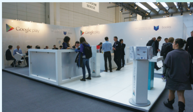
法蘭克福書展Google Play展區。