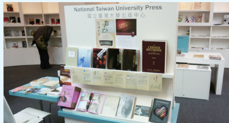
臺大出版中心於法蘭克福書展所展出的部分書籍。

臺大出版中心成立於1996年，至今已邁入第18個年頭，近年積極朝著「學術出版」的核心價值邁進，建立起文學、歷史、哲學、臺灣研究、社會科學與自然科學，以及藝術研究等領域的學術叢書。大學出版社的經營不同於一般商業出版社，普受閱讀大眾歡迎的偵探、愛