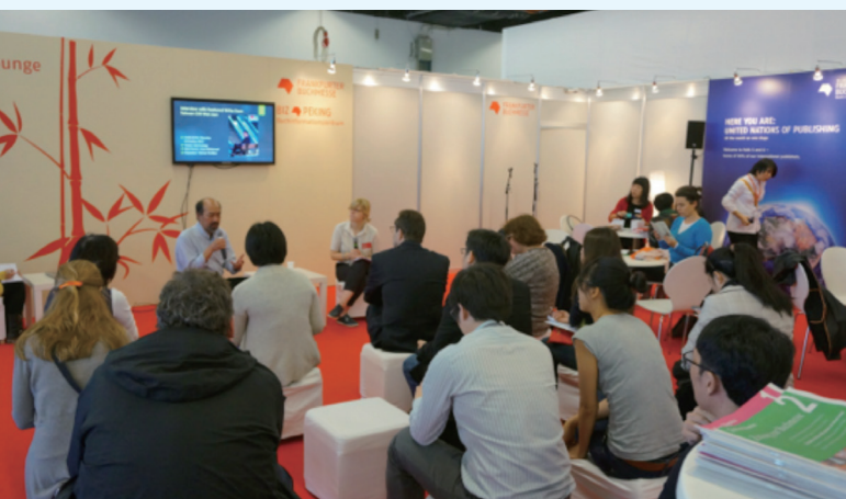
臺大戲劇系教授也是知名作家紀蔚然於法蘭克福書展現場座談。