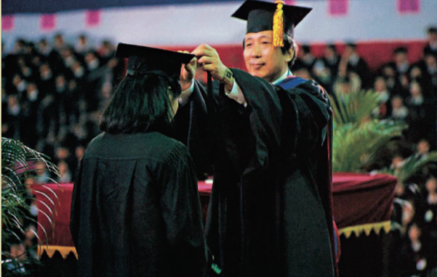
孫震校長主持畢業典禮，並為畢業生撥穗，所留下的珍貴照片，錄自《八十一學年度國立臺灣大學概況》。

版著作《邁向富而好禮的社會》、《回首向來蕭瑟處》、《臺灣發展知識經濟之路》、《時還讀我書》、《人生在世》、《理當如此：企業永續經營之道》、《經濟發展的倫理基礎》、《臺灣高等教育發展的方向》、《人生的探索與選擇》、《企業倫理與企業社會責任》等十餘本，於社會風氣之導正及國家經濟策略之謀定，有不可抹滅之貢獻。