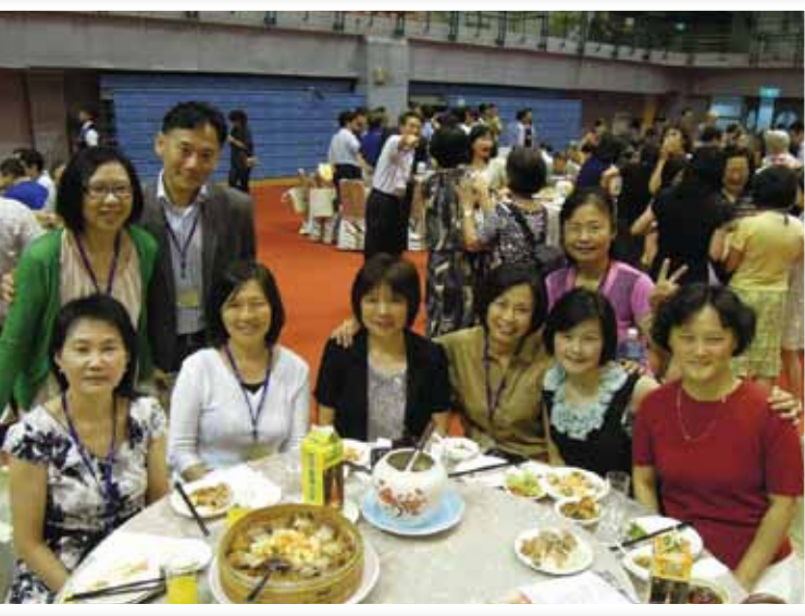
土木系插花歷史系。