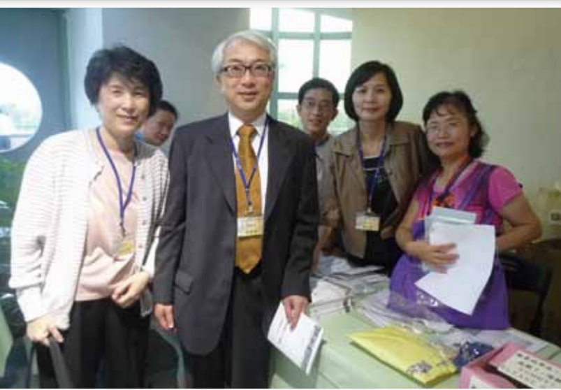
圖館系關國培從香港來。

到底誰失聯，哪個電話email可用，也是另一災難，學姊花了好幾個月將各系的榜單、畢業紀念冊名錄加上轉系資料一一比對，理出各系完整的學號姓名清單，轉請各系聯絡人各自下載後回報聯絡狀況，大家不清楚資料如何利用，手上又有各組寄出的表格要填，處理不完的結果就是“不理不睬”，畢竟系上同學要尋找、通訊錄要整理、照片要掃描上傳、訊息要傳遞公布、費用要代收，數據要統計……也夠忙得一塌糊塗了！