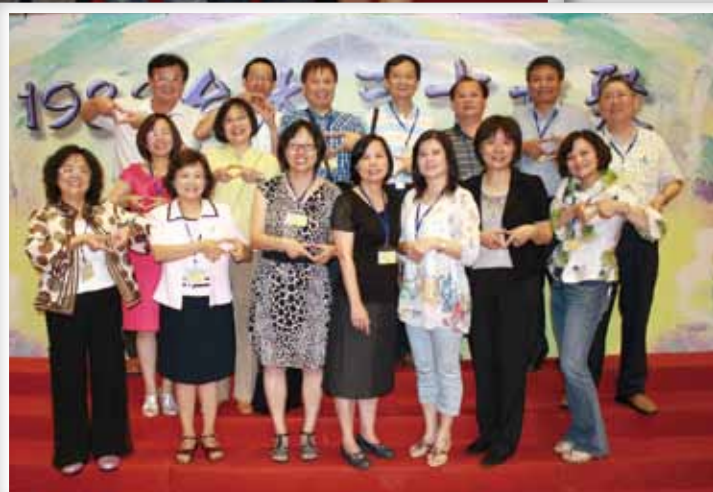
最有愛心的慈幼社。