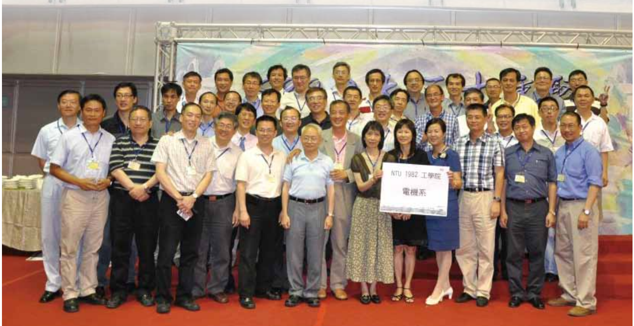
電機系陣容超龐大。