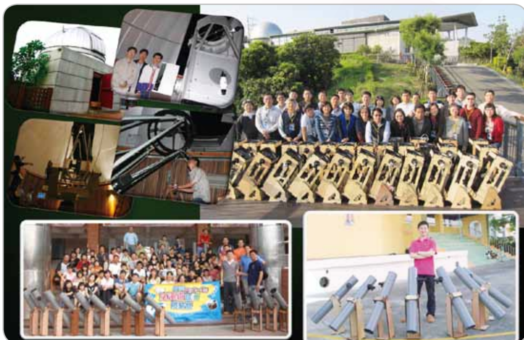
圖6：協助興建臺大鳳凰山天文台（左上）、臺南南瀛天文台（左中、右上），以及推廣的自製望遠鏡營隊。

為了研究宇宙，我們已花了不少納稅義務人的錢，但研究成果卻難以用於改善一般的日常生活，因此10多年來只要有餘暇便致力社會服務，以申謝忱。包括協助規劃興建臺大鳳凰