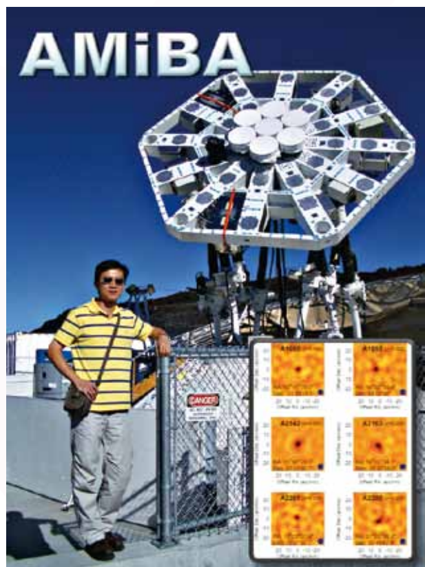
圖3：臺灣自製的宇宙望遠鏡阿米巴（位於夏威夷的毛那瓦峰 Mauna Loa；海拔約3400公尺），以及所觀測到的數個星系團。