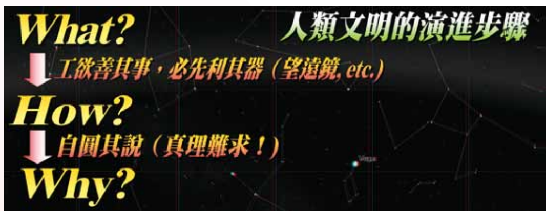
圖1：人類文明演進的步驟。

人類文明的演進，不外乎會先後經歷三個階段：what、how、why（圖1）。在回答why時，通常無關對錯，只問好壞，因為我們不是造物主，永遠不可能確切知道「對」的理論，不像數學有嚴謹的系統可斷黑白。「好」的自然理論是可以「合理地解釋現況、並且準確地預測未來」，符合「用」的原則，但任何的好理論終究都有可能是錯的。實際的例子之一便是牛頓的萬有引力理論，就學理而言，它早在百年前就已被愛因斯坦的廣義相對論所取代，但就日常而言，它仍是一個好的、實用的理論，因為要計算物體下落所需的時間時，你不會去解相對論中的愛因斯坦方程式，而是會使用簡潔的萬有引力理論。因此當我們在探討學理的同時，應有「真理永遠找不到」的心理準備，要以開闊的胸襟廣納各種思維，否則過度執著於現今的西學主流或拘泥於古學，都將無異於數個世紀前的「教會批判日心說」事件。