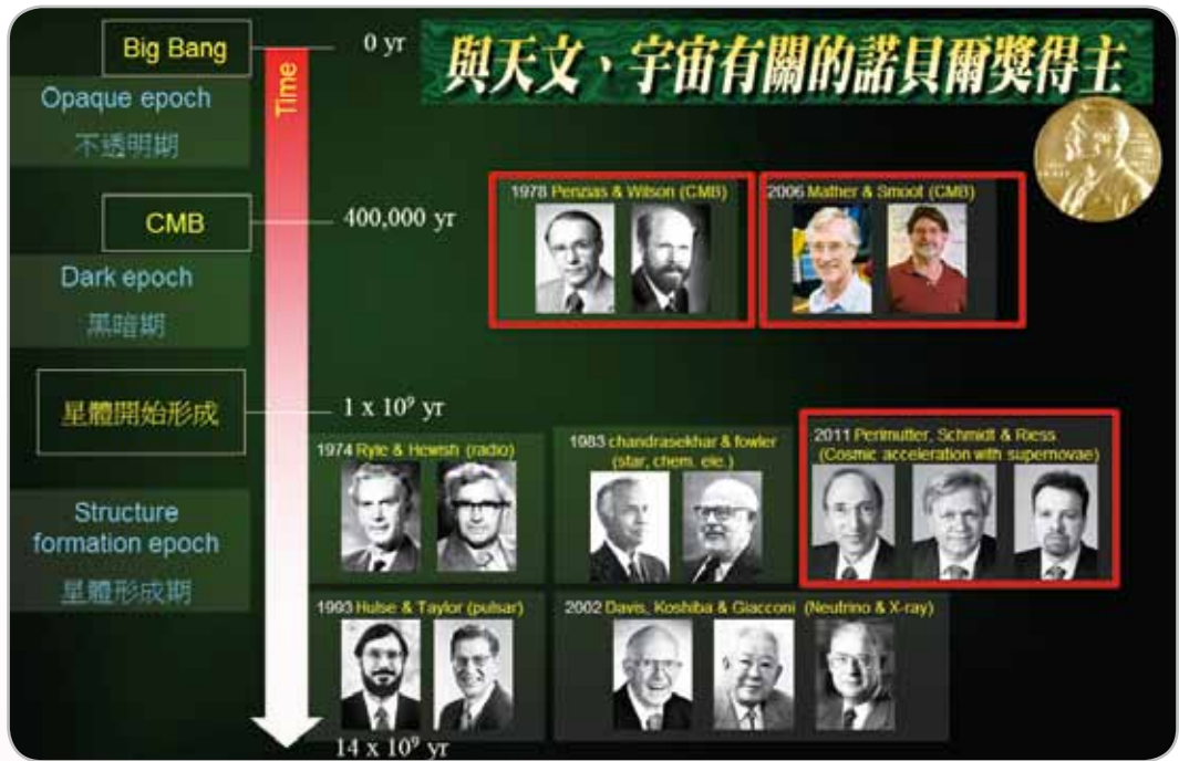
圖4：宇宙演化簡史，以及所對應的相關諾貝爾獎得主。

3年來我和史丹佛大學合作，擬於南極興建一座可偵測B模偏振CMB的望遠鏡，探索宇宙的前世今生，惟目前仍短缺約100萬美金，期盼獲各界支持。在未來的10年該領域定有令人驚艷的發展。（圖4）羅列了過去一個世紀以來，所有和天文、宇宙研究有關的諾貝爾獎，也許我們不禁要問：數千年前的希臘天文學說如今已成神話，如今諸多諾貝爾獎中，有多少將在未來成為神話？