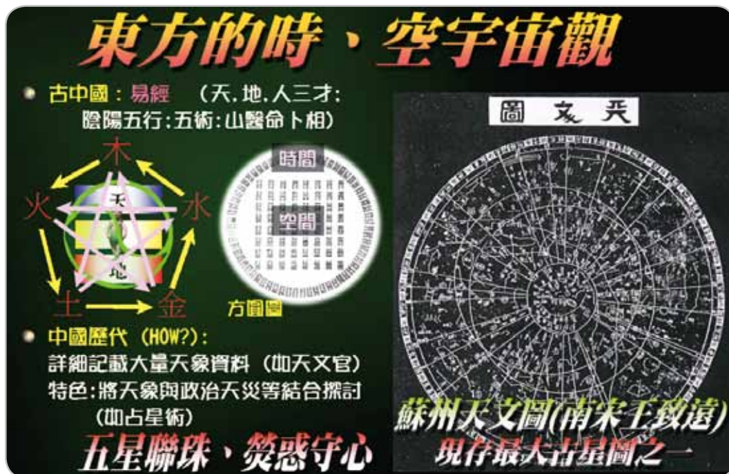
圖5：東方天文宇宙學的略述、特色與臧否。

論」(Loop Quantum Gravity)，在此架構下，我們現居的宇宙有可能是由其前身所生，而這也是我南極計畫所欲探討的核心問題之一。