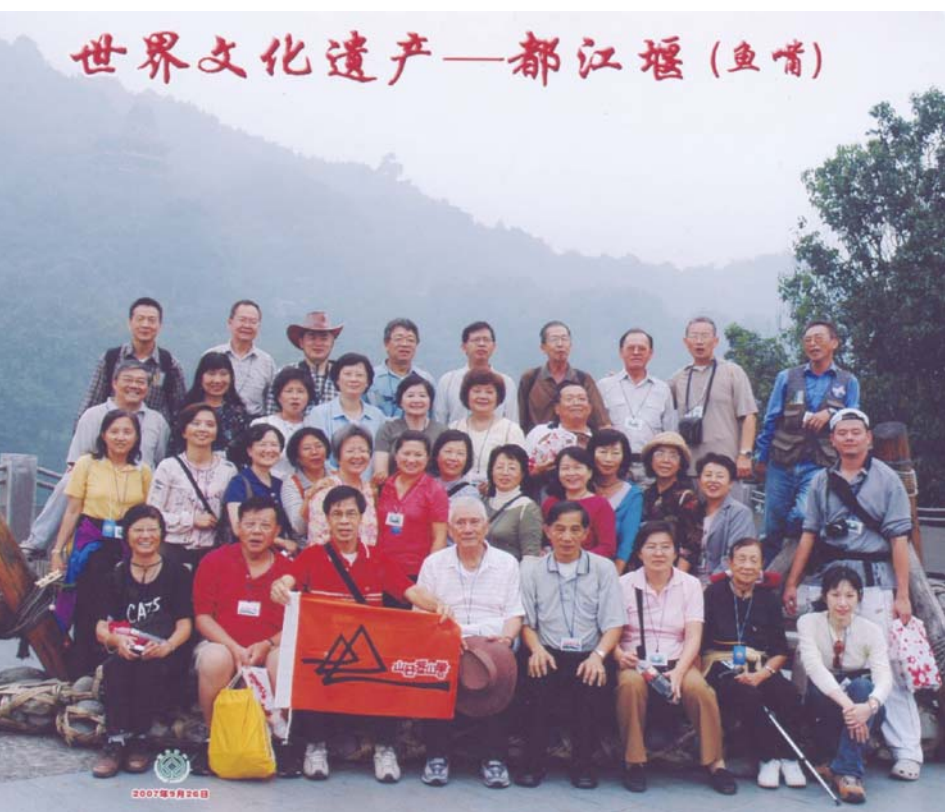
■ 於水利史上著名的都江堰合影。