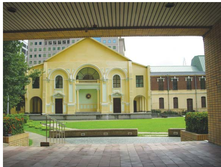
■醫學人文館後方加設表演台，提供學生藝術、音樂社團演出的場地。

至於研究，在邁頂計畫下，臺大醫學院以澳洲墨爾本大學和日本九州大學爲短期標竿。「主要理由是這2所大學的規模、人數與研究表現和我們比較接近，假如我們好高騖遠把東大設成目標，即使投入10倍經費，10年內還是達不到。」而爲了在短期內達成目標，必須重點發展，「選擇與臺灣和華人族裔有關疾病爲標的研究，才有可能取得領先地位。不要妄想成爲世界第一，那是不務實的想法。你不可能拼得過歐、美、日，但如能成爲華人最頂尖的，只要華人一生病就想到我們，這樣就達到目標了。」