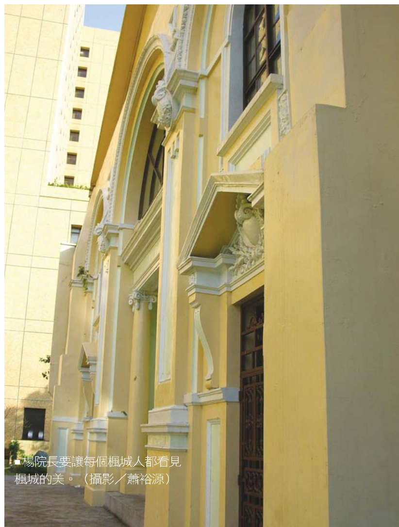
■楊院長要讓每個楓城人都看見楓城的美。

接手這家「百年老店」，他也有些新的想法。「臺大醫學院已經100多年，有很悠久的傳統，大家對臺大醫學院有不錯的 image，但我們是不是真的很好？好像還有很多要努力的。到底我們自己的定位在哪裡？需要再想一想。我一直認為臺大優勢是學生優秀，不是老師優秀，老師有責任讓學生比老師更好。學生是我們的 future 和資產，所以把人才培育的事情做好最重要。」他認為臺大醫學院不僅是醫事人員訓練所，而是要培養「一個好的醫事人員、社會的 leader，成為帶動學術或社會進步的原動力。至少不做