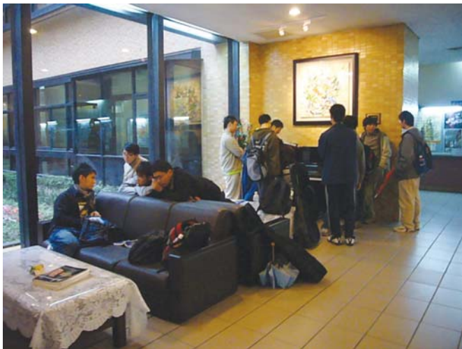
■醫學院大廳一隅，鋼琴聲伴隨讀書聲，讓嚴肅的學術殿堂憑添幾許感性。