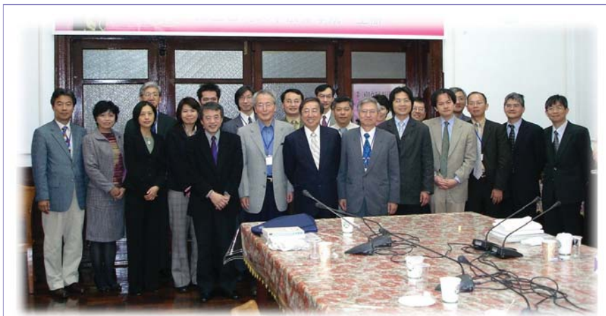
■ 2007 年 3 月 4-5 日東亞法治之形成計畫舉辦日台憲法會議，會後與會人員合照。

計畫目前正進行網站建構工作，將於近期上線，歡迎屆時上網瀏覽。如需詢問相關訊息，可寄至計畫專用信箱： ntulawtop@ntu.edu.tw ，或與王品仁小姐聯絡（02-2351-9641 # 423）。