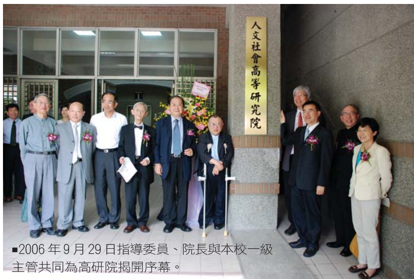
■2006年9月29日指導委員、院長與本校一級主管共同為高研院揭開序幕。