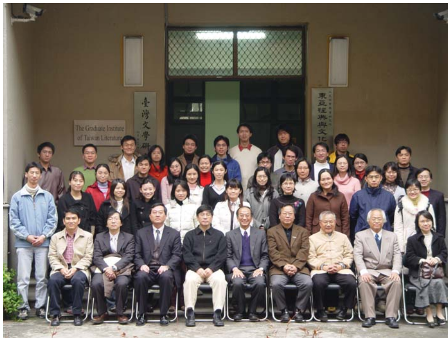
■2007年1月27-28日舉辦「東亞經典與文化」研究生研習營，計畫同仁與所有研究生合影。