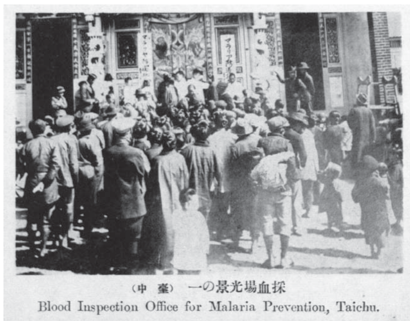
(中 臺) 一の景光場血採 Blood Inspection Office for Malaria Prevention, Taichu.

■ 瘧疾是臺灣在十九、二十世紀之交主要的風土病之一。日本據臺後即積極展開調查與防治工作。圖為日本官方在臺中地區採集民眾血液進行檢驗。