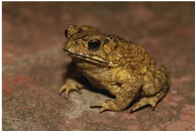
■ 臺灣原生蟾蜍之一的黑眶蟾蜍，最愛大合唱。

臺灣僅有兩種原生蟾蜍，牠就是其中一種。全身佈滿突出且會分泌毒液的疣粒，雖然長相醜陋，但是這些毒液是用來保護自己的，人類只要不吃牠，自然不會有何影響。倘若您可以蹲下來慢慢地觀察牠，相信你一定會喜歡上牠溫柔、可