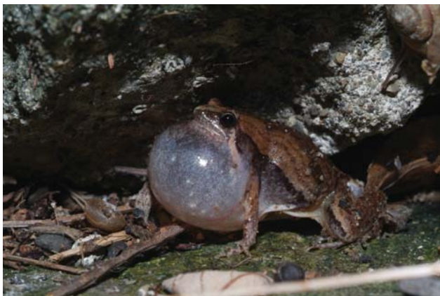
■ 小雨蛙最浪漫，就愛雨天。

聽到這個名稱，大致上就可以猜出牠的個頭不大，而且喜歡在下雨天出來活動。沒錯！牠是臺灣5種狹口蛙科的一員，體型大約2-3cm，背部棕褐色的塔狀花紋，繁殖季節以春夏為主，若是遇到下雨天，牠們可是會叫地更加起勁。大家可別看牠個頭很小，當牠鳴叫時，鼓起的鳴囊跟牠身體一樣大，所以聲音非常的大聲，叫聲為「咯咿～咯咿～」，聽起來很像上發條的聲音。而牠的蝌蚪更是有趣，除了小腦袋跟兩顆眼睛外，其他部位都是半透明的，要用力看才會看到牠們有！