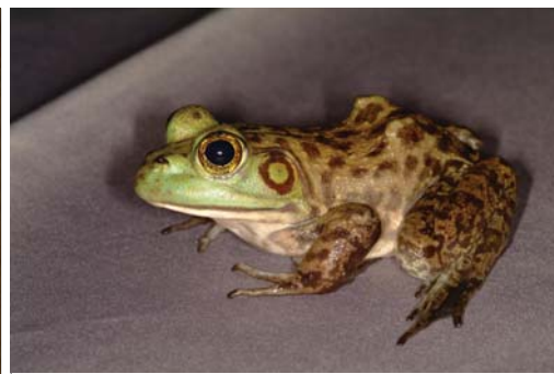
■ 體型壯碩的牛蛙是從美國來的不速之客，蠶食本地青蛙的生態。

的話還以為是狗叫聲，其實這就是貢德氏赤蛙的聲音喔。牠的體型也不小，約10-12cm，背部為金黃色，體側為棕褐色；也由於牠的叫聲，我們會稱牠作「狗蛙」。大家可別看牠在平地還算蠻常聽見的，牠可是農委會公告的II級保育類野生動物，當初就是因為牠的體型較大，常被民眾抓來吃，所以將牠列入保育類名單，現在牠才能挾著免死金牌，安然地住在市區的各池塘中，繼續開心的狂吠。