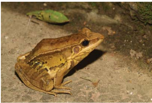
■ 貢德氏赤蛙叫聲像狗，所以又名「狗蛙」。牠可是保育類。