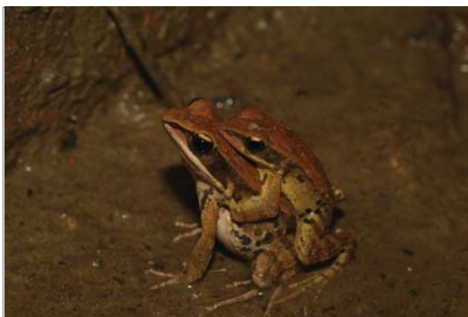
■ 拉都希氏赤蛙繁殖力旺盛，沒有淡季。