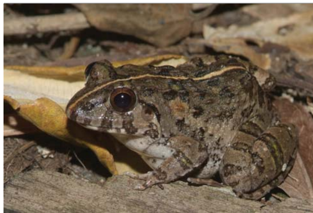
■ 澤蛙就是民間俗稱的「田雞」。

現在要介紹的澤蛙，與上述的黑眶蟾蜍、小雨蛙，三者可說是臺灣蛙類的「平地三寶」，換句話說，也就是平地最常見的三種蛙類。澤蛙應該是大家最熟悉不過的，牠就是民間俗成的「田雞」，體型約4-5cm，鳴叫聲音為「噉～噉～噉～噉～噉～噉～」，體色更是變化多端，從棕褐色到全綠色都有，身上有短棒狀突起，因此偽裝的效果特別好。牠的生性相當警覺，要是靠近牠一點，牠就撲通跳下水，往往只聞跳水聲，不見其影。另一種外型相似的虎皮蛙，體型約10-13cm，為早期民眾釣青蛙的對象，原生的族群已在臺大消失，大家可別誤認囉。