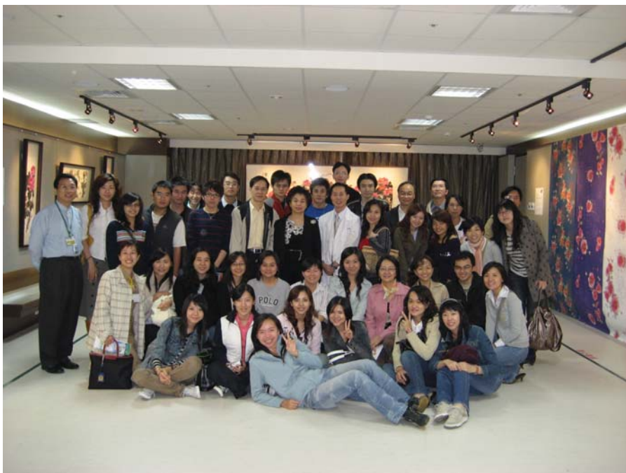
■醫管所強調實務與理論並重，圖為安排師生參訪醫療機構。

動，則透過參訪行程的安排，讓學生提早接觸實務界，對醫院的管理模式及特性有更深入的了解。