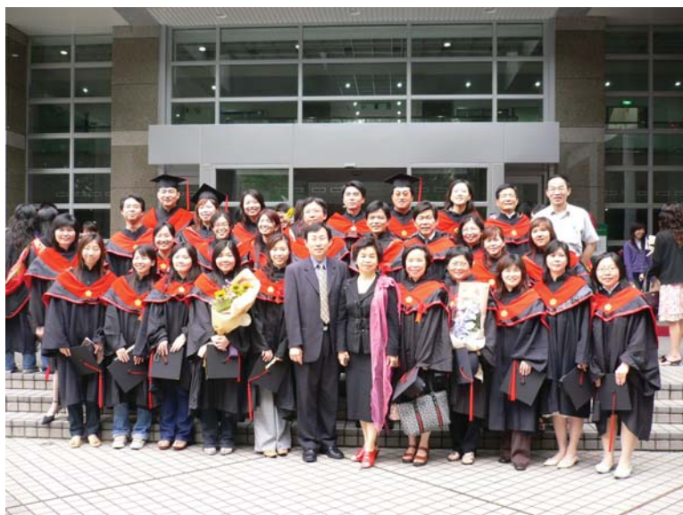
■ 醫管所在課程規劃講求彈性，要能配合時代脈動與社會需求。圖為 94 學年度撥穗典禮。