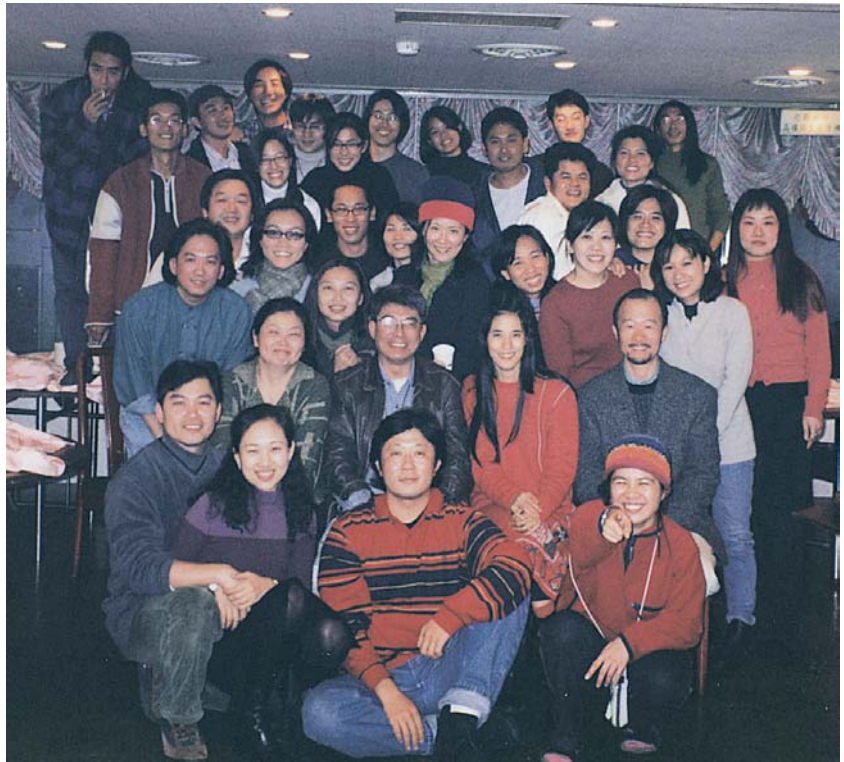
■2000年1月，多面向10週年，全體工作同仁團聚慶祝。

走過臺灣紀錄片荒漠，李道明認為從1990年代中期以降，臺灣的紀錄片已蔚為顯學，主要動力來自政府力挺。「文建會自1994年起開辦文化紀錄片國際影展及研討會；1996年台南藝術學院成立並創設臺灣第一個紀錄片研究所，同時全景基金會受官方委託開辦紀錄片人才培訓班；有民間團體及正規學校培養人才，有國際影展行銷臺灣的作品及引進最新製作理念，還有政府與民間機構提供經費補助。不出幾年，臺灣紀錄片的質與量都大幅提升，2004年《生命》締造了1千萬元票房，是那年所有臺灣電影的第一名，這表示觀眾願意花錢來看紀錄片，後來的《翻滾吧！男孩》、《無米樂》的聲勢都超過劇情片，能說不是顯學嗎？連企業界都主動贊助，表示有相當