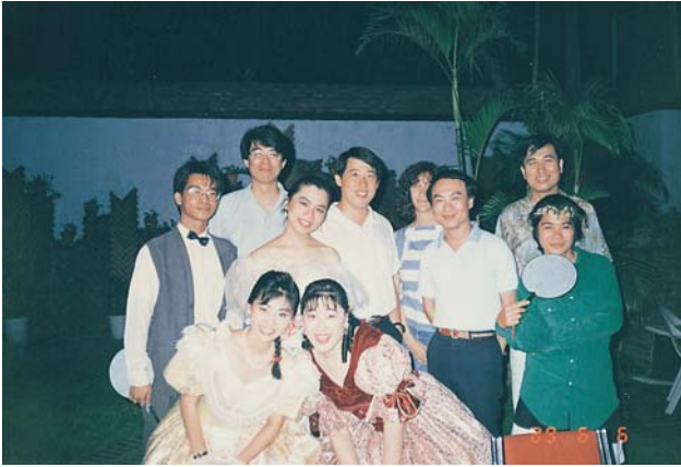
■1990年任教文化大學戲劇系電影組，與畢業班同學合影。

作，算是半個『多面向人』；我們多面向的同仁每年還會聚會好幾次，看見他們，讓我感到蠻欣慰，因為多面向這個招牌現在在業界還算響亮」。