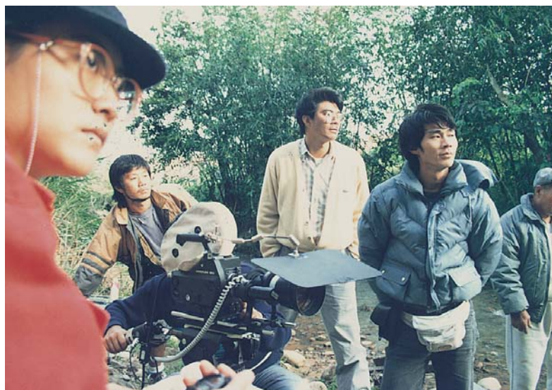
■ 1986 年拍攝中影公司電影《吹鼓吹》現場工作照。