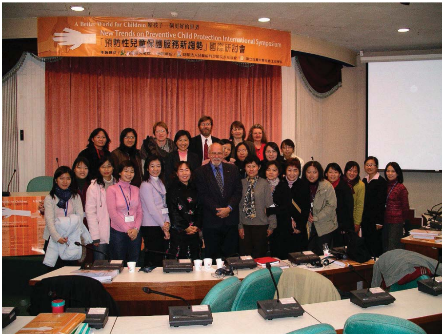
■ 不同於一般科系，社工系是一個以服務為職志的科系，圖為社工系同仁攝於預防性兒童保護新趨勢國際研討會。