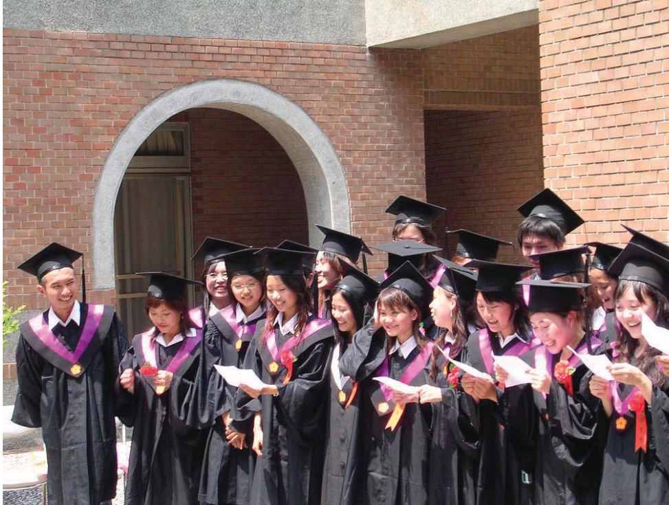
■ 社工系是台大社科院最年輕的系。

惟人各有志，部分學生未必喜歡投入政府工作，反而嚮往非營利組織的彈性與創新，故每年約有六分之一到五分之一的學生，投入倡導型的非營利組織或直接服務型的社福組織，也有以耕耘社運團體為「職志」的畢業生，個個在非營利組織中擔任重責，例如：創世基金會、人本基金會、兒童福利聯盟、現代婦女基金會、勞工陣線等，為台灣的民間社會福利與社會工作增添許多的活力，也提升台灣社會福利和社會工作的願景。