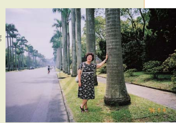
■2006年,以香港留台大學校友聯會 主席身份回台大拜會李校長。今日的 我,對比當年,學問倒退 20%,見識 增加 200%, 體重增加 50%。