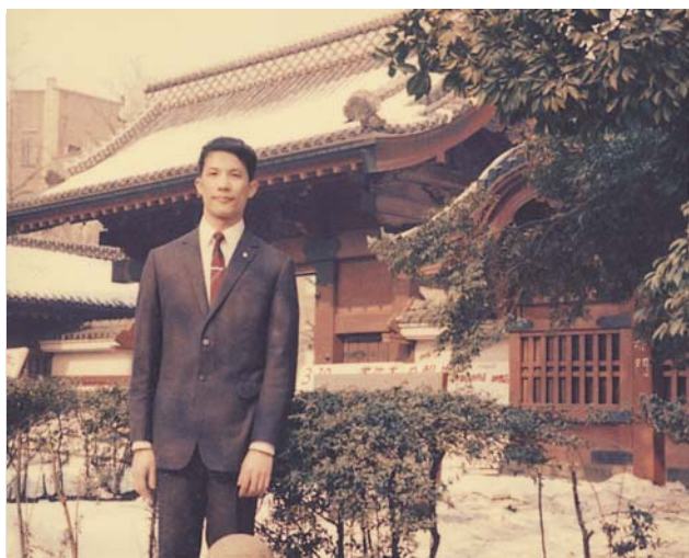
■ 賴浩敏在留日期間，於東大赤門留影。

「其實他還想再讀書」，古登美呼應他的話。所以當她看到公費留考訊息時，她毫不猶豫替他報名。兩人在台大雖都修過 3 年日語，但同期赴日留學的有許水德（前考試院長）、楊維禎（前台大電機系教授）、陳耀東（前最高檢察署主任檢察官）、郭汀洲（前駐日副代表）等許多前