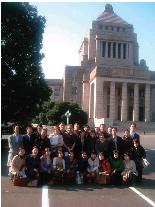
■ 東大法學部留學生參觀國會議事堂,筆者位於中排右 5。

針對在海外設置辦事處一事,由於位在亞洲,而且在東京大學就讀的留學生有 80% 來自亞洲地區,其中又以來自中國的學生居多,東京大學首先在 2005 年成立了北京代表處,其主要目的在於(1)促進與中國知名大學和研究機構的學術交流;(2)推行在中國的產官學合作關係;(3)