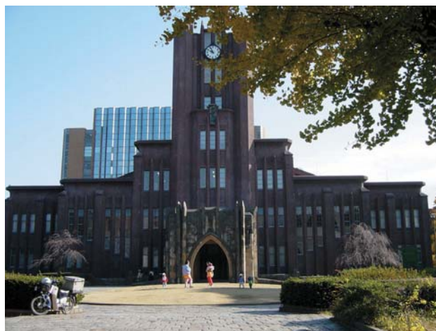
■ 東大地標之一:「安田講堂」。1960 年代學生運動曾聚集於此。

招募優秀的中國學生到東京大學留學和派遣東京大學學生到中國知名大學留學;以及(4)支援中國東京大學校友會的活動。除了北京代表處之外,也計畫在 2007 年成立首爾代表處,提升與韓國的交流層級。