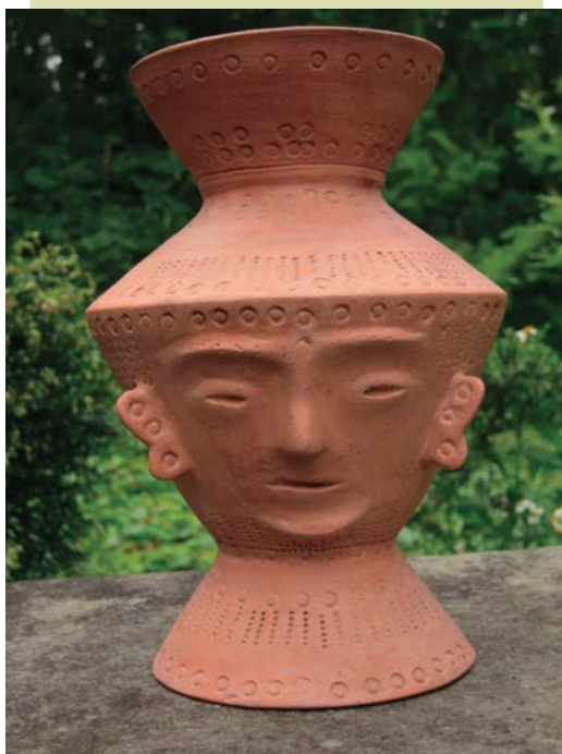
■ 仿製史前陶是他的絕活，圖為仿製之十三行遺址出土的人面陶罐，維妙維肖。

他發明了一套複雜工法，可以「與地心引力對話」：「陶土在不同的乾燥期承受力也不同，我顛倒做，把桁架都黏上去後，再旋轉 180 度擺正」。方法的確妙，可是失敗率還是很高，半年內做六件壞六件，幾乎成了折磨。他說爲了保持濕度，夏天連窗戶、電扇都不敢開，悶在工作室裡，「我做了幾件，就代表我中暑幾次」。