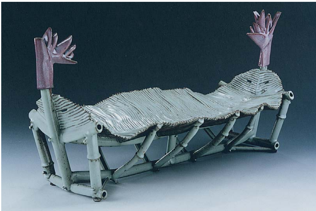
■ 蕉葉構成甚受韓國人喜愛。

另類的理由之一是他非科班出身。「從課本學到的知識是受制約的，不是自己真正感受到的，而我的創作都是憑直覺與感動。」他強調的是藝術創作需要敏銳的感官。「印尼有個部落，所有人都会作陶，陶工直接將土放在嘴裡咀嚼，來感受泥土的延展性，從味道來決定土質等級」，但現代人過於依賴科技產品，已經失去用感官知覺