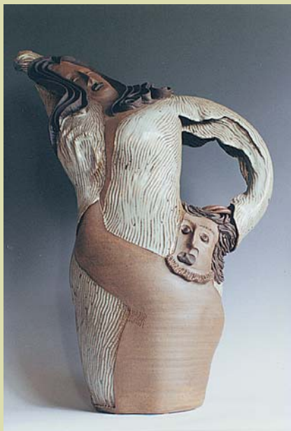
■「神話系列」靈感源自排灣族創生神話。

「蕉葉構成」收到各方的好評，不過概念的形成可是經過多年醞釀。一開始的 idea 源自阿美族人的「石煮法」：「他們將檳榔葉兩端葉鞘上折成容器盛水，然後將燒熱的石頭置入水中，沸石燒水，水滾了，魚也熟了。」這個人類學所謂的”culture shock”給他葉子容器的靈感。決定用「蕉葉」的形式，最初的印象來自於工作室外的垂蕉，但直接摹仿就不是藝術，他還必須尋找適當的表現方式。真正的靈感得自一位 92 歲長者。2001 年爲了辦個展，他腸思枯竭，天天漫無目的的遊蕩，有天看到一位老先生正在蓋草寮，挑動了他的想像。「他用六根 Y 字型的油加利樹幹插在地上當支架，用粗竹子當樑、細竹當椽木，再舖上稻草，稻草上壓疊更細的竹子，然後以竹篾捆綁固定，實在很有趣。他巧妙地結合天然材料，讓我聯想到我也可以將垂蕉的葉子摺曲，底下用竹架架住，這就是我要的！」可是問題來了，製作蕉葉的薄泥板起碼有五公斤重，用陶土做的桁架根本撐不住，經過多次嘗試，