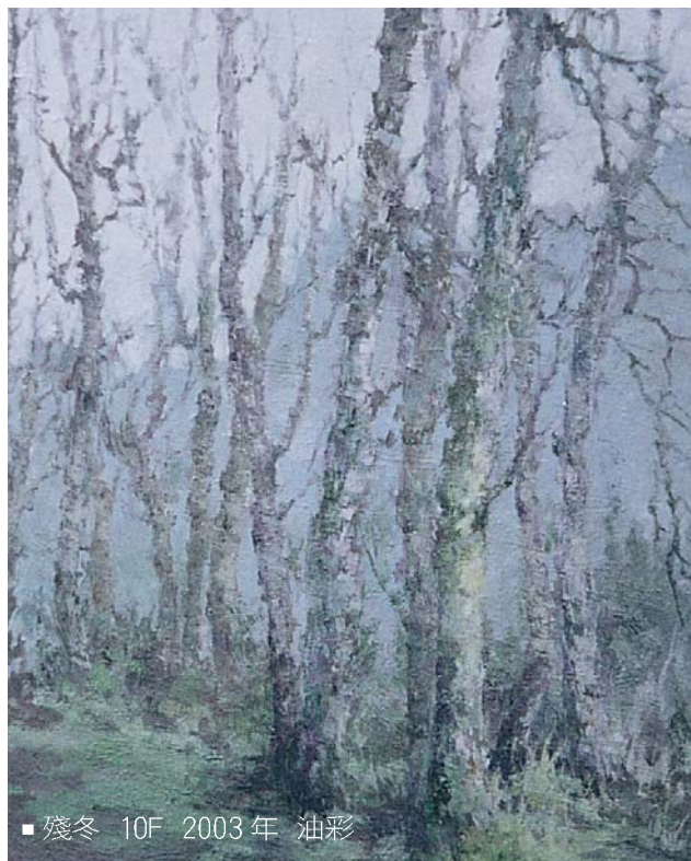
■ 殘冬 10F 2003 年 油彩

錯的線團，如果我總是企圖去拆解開來，或者不時地想把零亂的千百條線頭好好地捲回去，這樣的舉動，又是否太過荒謬，或僅僅多此一舉，徒讓自己一次次地自傷？這些人、這些事，不斷地在我眼前閃現，讓我無法一刻稍安，正如今晨我所見的那些人，總令我不由自主地想到，人們最終都將把他們一一送往生冷的洞穴、腐蛀的棺木、乾枯的白骨……，這時候，我突然驚覺，那枯瘦的老婦其實代表著所有的人類。