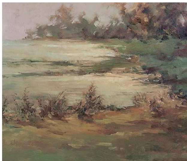
■ 斜暉脈脈 10F 2002 年 油彩

佛經說：「我今但以一尋（七呎）之身說於世界，世界集，世界滅，世界滅道跡。」太陽升起了耀眼的光翼，天空泛出斑斕的色彩，這一切，豈是爲了我一個人而湧動？我日日觀看著這城市的千姿百態，日日將一幕幕景象移轉到畫布上，一個停頓.....或一片虛無，浸潤著我，穿越我，以一種無言的微弱，在我的畫布上喧囂