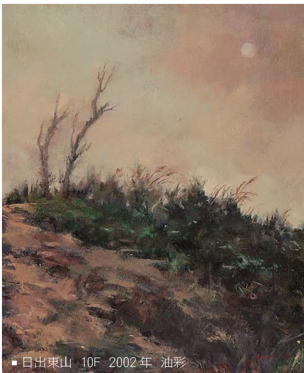
■日出東山 10F 2002年 油彩

苦澀地感同身受，彷彿那失眠的人是我，那疲累的殘骸是我。當我分擔他們那份孤寂的時候，那無盡幽暗的感覺是它們內在於我卻又同時外在於我，而我無能為力。這一份惻然，是我在清醒狀態下創作時的溫度。