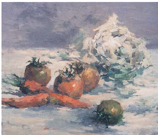
■ 蔬果 10F 2003 年 油彩