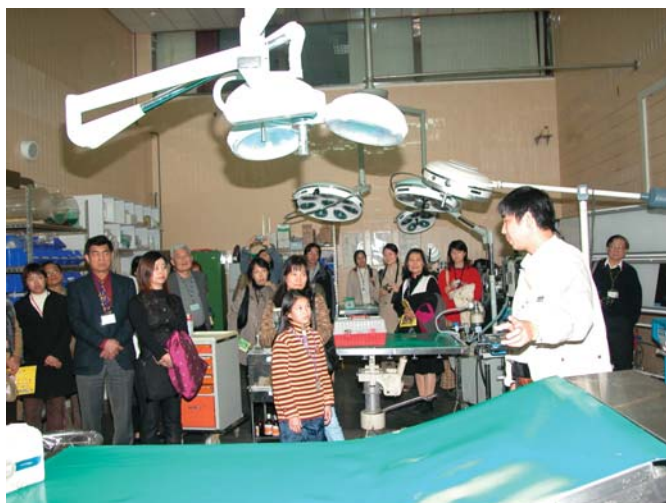
■ 親子日邀請學生家長參觀台北市立動物園醫療中心。

醫學合作對抗新興與再浮現人畜共通傳染病的威脅、保障畜產品的安全與衛生、以動物為模式研究人類疾病、培養毒物病理科學研究人才、提供生物醫學研究用實驗動物的疾病監控與管理，以及疾病診斷多元化的教學、研究或社會服務層面，均有良好之表現。然而這樣的人才與實力並未能充分發揮應有的教學與研究效果，主因在目前的獸醫學系架構下，人力、物力均不足，無法提供師生最佳的學習與研究環境，以致不易達到符合世界潮流以獸醫學院為架構的教學與研究目標。