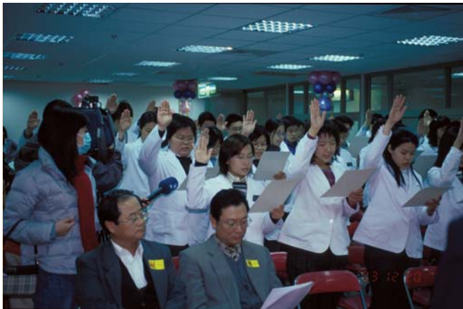
■ 每年大五學生實習前，舉行獸醫師宣誓典禮。

爲了讓系友了解本系近況，便於群策群力協助系所發展、在學學生規劃生涯及系友發展事業，從而激發系友對母系的奉獻心與榮譽感，發揮系友對學校及社會影響力，多位熱心系友出錢出力於 1991 年成立「台大獸醫系系友文教基金會」。基金會規劃完善的系友會網站，舉辦多項活動，如邀請系友返系演講創業心路歷程，邀請學生家長參觀系所及教學醫院，開發紀念品贊助系務、獎學金、研究論文海報競賽、甄選學生赴日研習等，其中以「戀戀獸醫，心繫母系」年度系友大會，結合了系友大會、獸醫之夜、獸醫師宣誓典禮及聯合導生會，展現台大獸醫系學生在專業素養外，極富創意、活潑的一面。尤其 2005 年本系成立一甲子，系友與在校師生共 200 餘人齊聚一堂，共度此一值得慶賀的大日子。系友會並將歷年之建築物製成模型，獻給母系，以示感念。