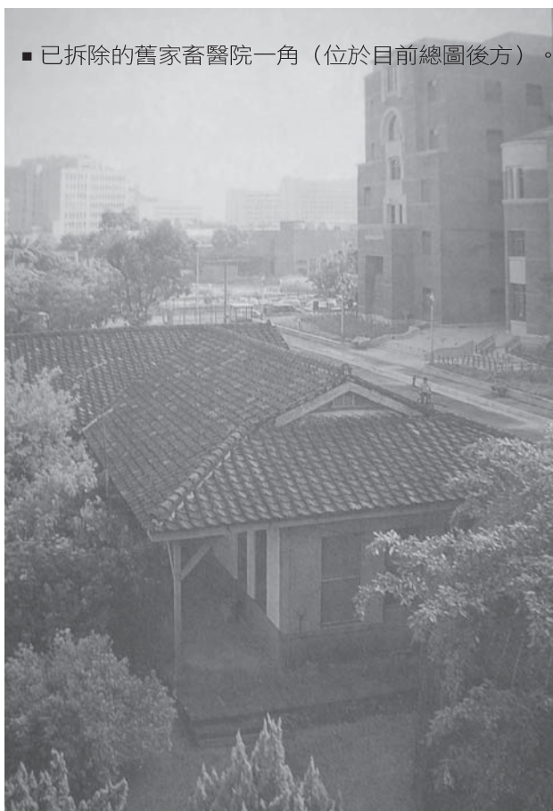
■ 已拆除的舊家畜醫院一角 (位於目前總圖後方)。

麻布與代廣大學等；而國立大學除北海道大學外，其他仍多隸屬於農學部 (院) 的獸醫學科 (系)。為充實獸醫教育，日本自 1999 年起即由教育部提撥經費，以推動改善研究，其中針對各國立大學獸醫學系升格為學院的改善工作仍持續進行中。韓國為因應生技產業的高度發展，亦於 1996 年將獸醫教育年限由 4 年改為 6 年，目前有 7 所獸醫學院。其他亞洲國家如菲律賓、印度與泰國各有 2 所獸醫學院，馬來西亞 1 所，而鄰近的中國大陸亦有 2 所。過去我國之獸醫教育制度十分混亂，為與全球獸醫教育同步接軌，教育部在民國 78 年即函請本校農學院擬定獸醫教育改革計畫，在本計畫推動下，自 80 學年度開始，教育部同意本系先行擴大為兩班，且每年增聘 4 位老師，預計 5 年後改制為獸醫