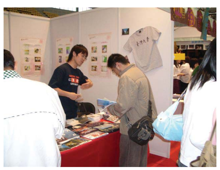
■ 配合校慶、杜鵑花節等活動,出版中心擴大舉辦書 展,推廣本校出版品。