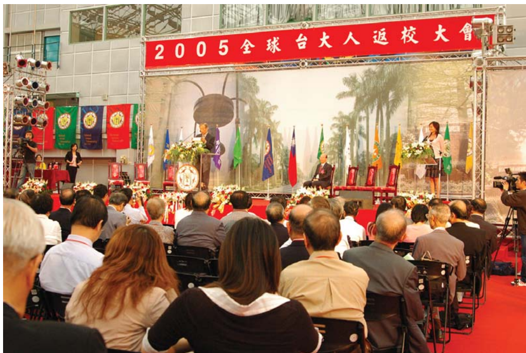
■ 全球台大人返校齊聚一堂為母校慶生。

此外台積電張忠謀的演講，也深入我心。他認為台大應以培育領導人材為目的和職志。台大人更應以將來成為各行各業的領袖自許。作為領導人應具備的特質至少要涵蓋：（一）正確的價值〔人生〕觀。（二）高操的品德，諸如誠實、正直等。（三）要能終身學習和獨立思考。（四）要有溝通的能力。（五）要有國際觀。（六）除具備專業的專長之外，更要成為通曉各領域通識之“全才”才足以統馭應變，以冠蓋群雄。這一番話切確的訓勉了台大人要有成為領袖群倫的