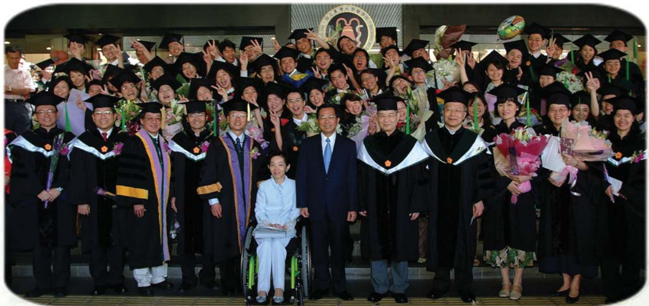
■ 93 學年度牙醫系畢業典禮，陳總統伉儷以家長身分出席。