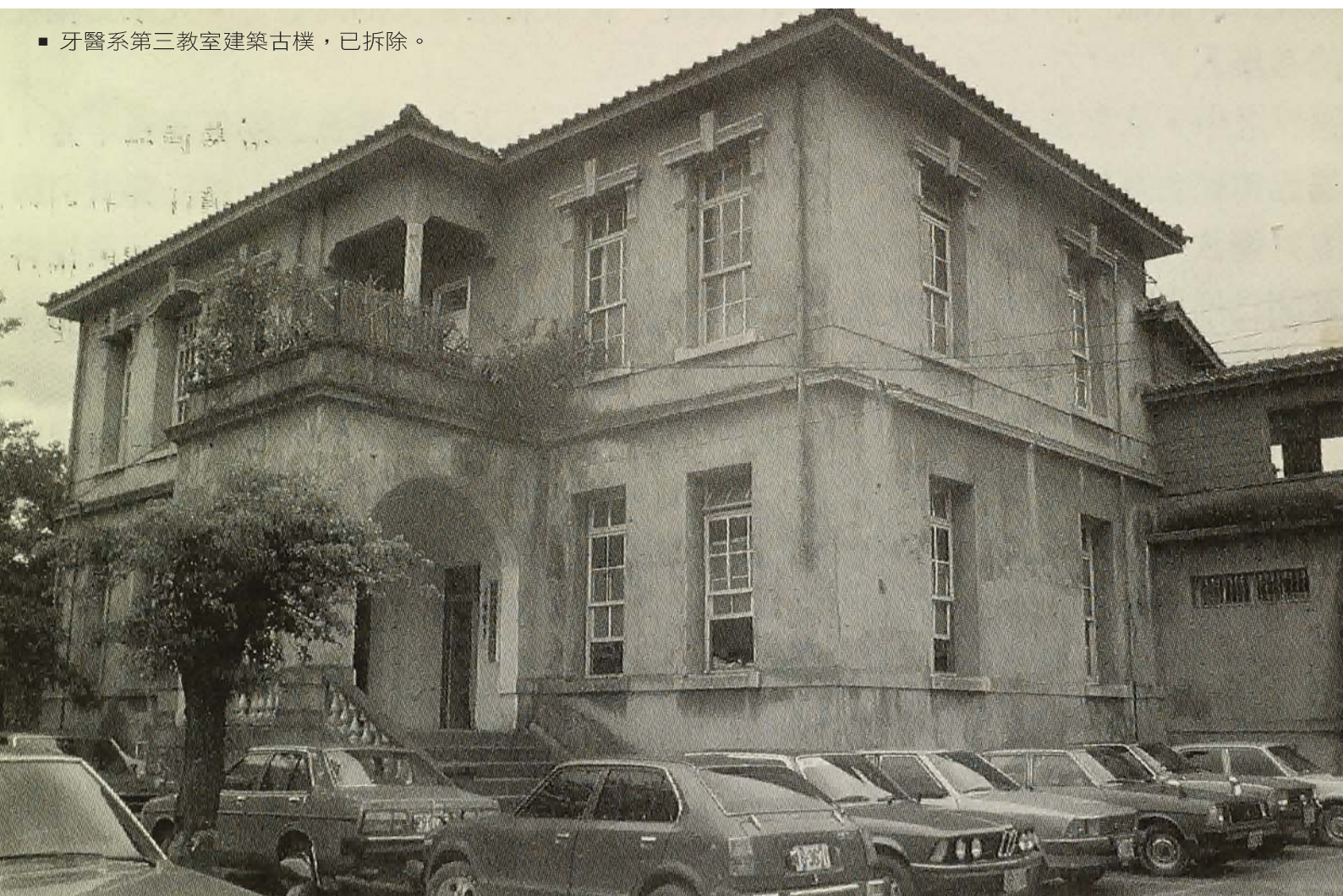
■ 牙醫系第三教室建築古樸，已拆除。

校友會除舉辦各種聯誼活動聯繫系友感情，也常舉辦學術或執業研討會以促進學術交流、交換診療經驗，並協助系友開業事宜增進福利。此外，校友會對於協助母校發展並輔導在校學生之回饋一直不遺餘力，除每年例行舉辦針對畢業生之系友座談會之外，2004年也協助母系成立「台大牙醫醫事人員訓練中心」之運作。此訓練中心成立之緣由，是考量專業訓練與繼續教育在醫療服務品質與量的精進占有重要的地位；同時明確延伸牙醫教育的時程，落實終生學習，落實全人牙醫的實踐。並且每年定期於3、4、5、6、7、8及11月會針對不同主題，如美容牙科—瓷牙貼面，口腔顎面外科之植牙精進計畫，牙周病科，齒顎矯正，根管治療等進階領域，舉辦一系列之